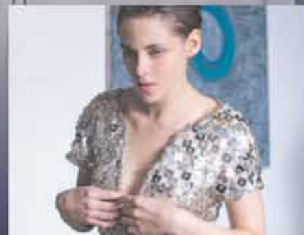
Kristen Stewart in ‚Personal Shopper‘