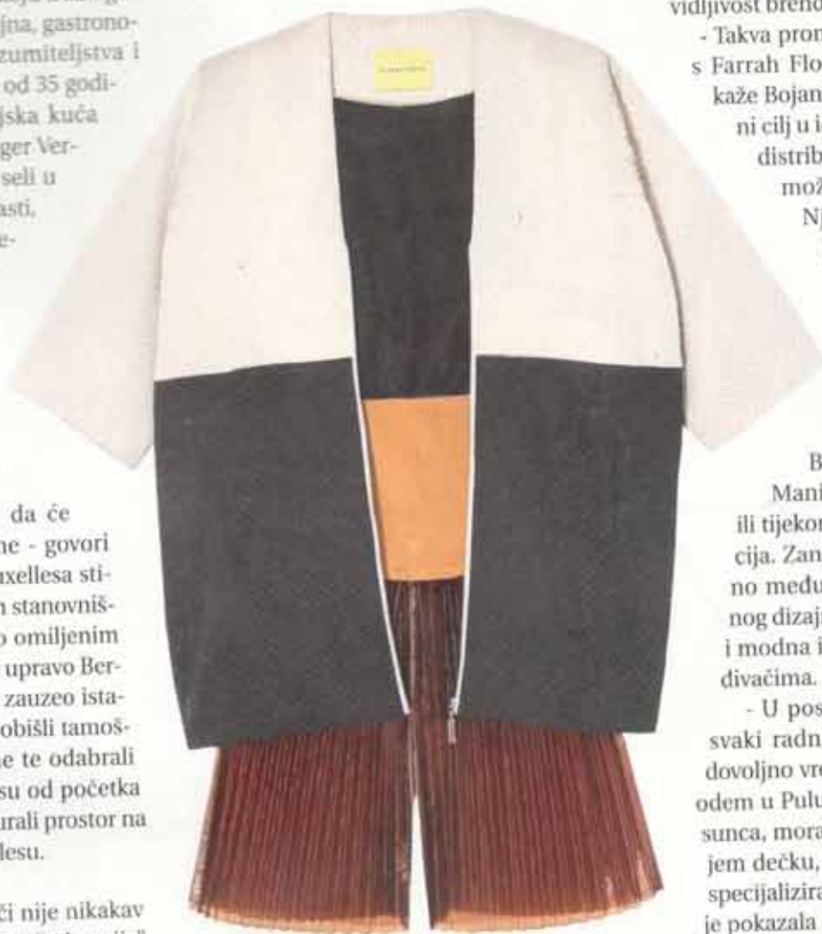
U Bojaninim kreacijama prevladavaju geometrijske linije i uzorci

- Farrah Floyd je ekskluzivni brend, koji cjenovno pripada višem srednjem razredu: